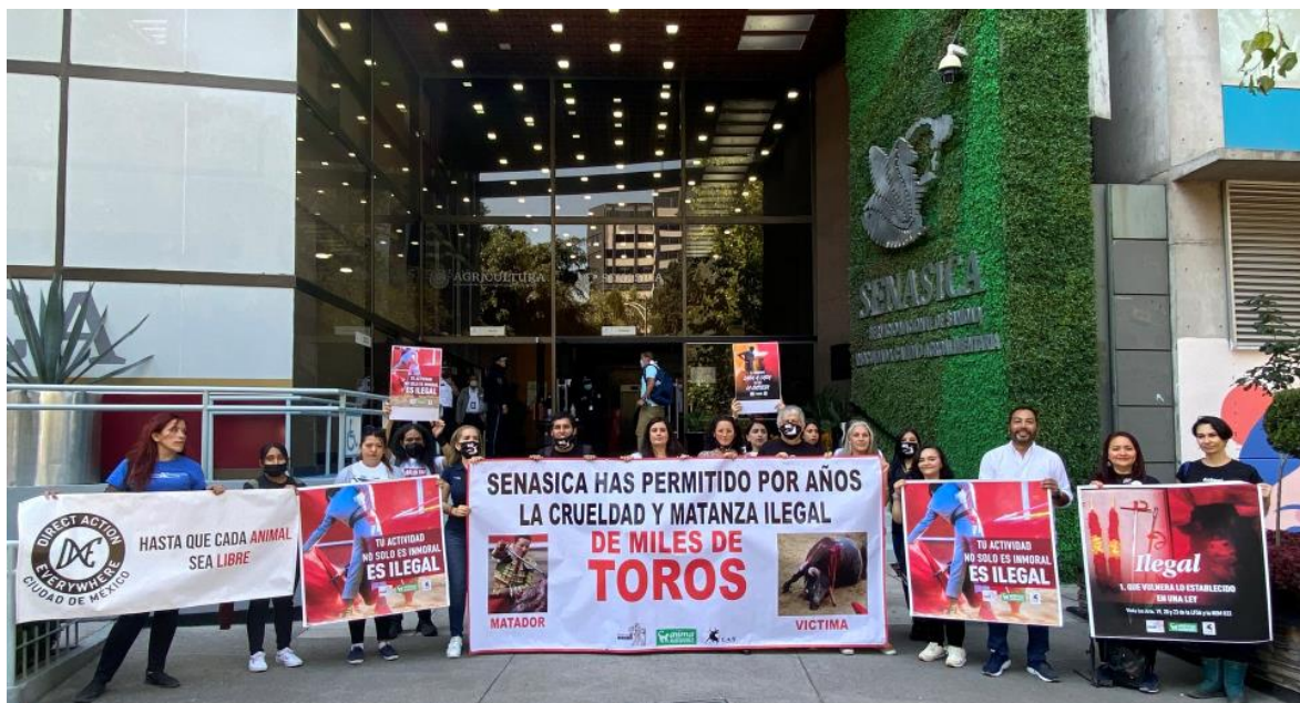
Een protest van het International Anti-Bullfighting Network in Mexico stad in 2022.

Naast het versteken van ons Internationale Netwerk willen we de contacten en samenwerking met organisaties binnen de EU versterken, onder andere via Eurogroup for Animals.