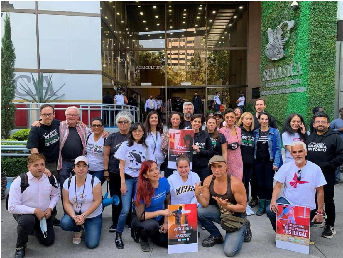
Een protest van het International Anti-Bullfighting Network in Mexico stad in 2022.