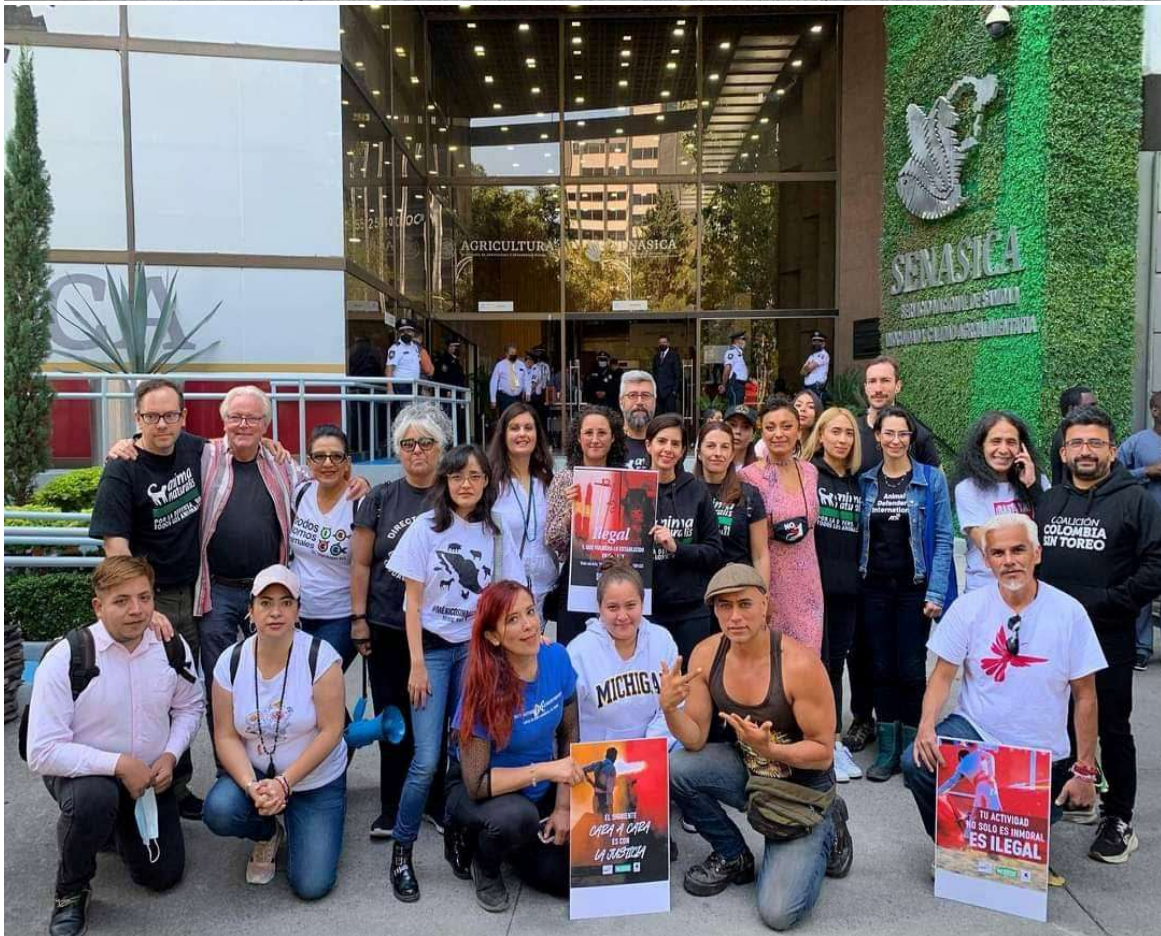
Protest bij Senasica tijdens de summit in Mexico-Stad in november 2022.