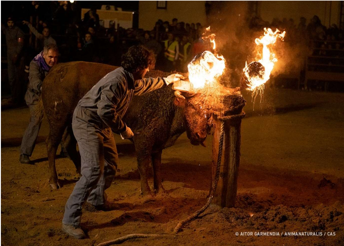
Een vuurstier tijdens 'Toro Jubilo' in Medinaceli (Castilië en León).

Naast het onderzoek werd er een documentairemaker ingehuurd die misstanden bij feesten met stieren, met name de zgn. vuurstieren, aan het licht brengt. De documentaires worden ingezet om het publiek voor te lichten en voor politieke lobby, onder meer via persberichten, over de gruwelijkheden van dit soort evenementen.