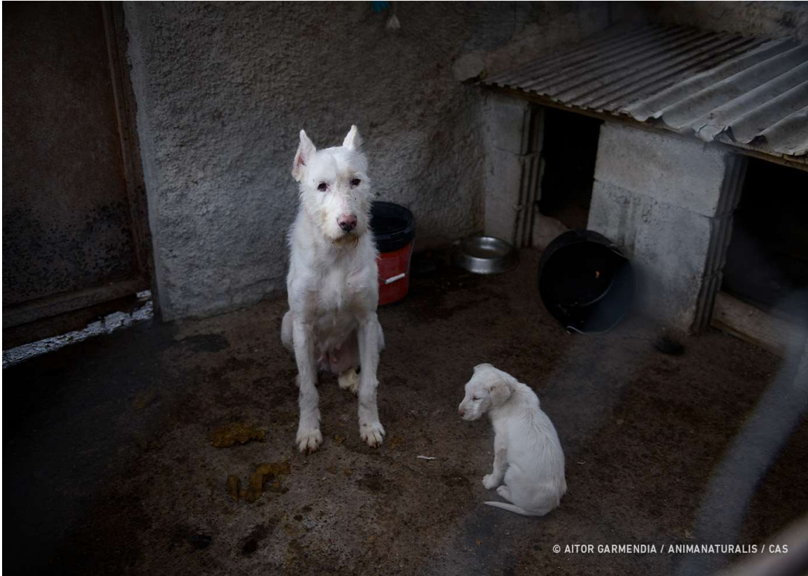
Een jachthond en haar pup in een van de fokkerijen voor jachthonden in Spanje.

Samen met AnimaNaturalis Spanje hebben we een grootschalig undercoveronderzoek uitgevoerd naar de omgang met jachthonden en de wrede praktijken tijdens de jacht. Verschillende jachtpraktijken, waaronder traditionele 'monterías' zijn gedocumenteerd en er is beeldmateriaal van de fokkerijen en kennels waar jachthonden worden gefokt en gehouden onder erbarmelijke omstandigheden. Het onderzoek is het eerste onderzoek in Spanje hiernaar. Er is nooit eerder zo naar de jacht gekeken. Op www.savehuntingdogs.org is informatie te vinden en kan een petitie worden getekend.