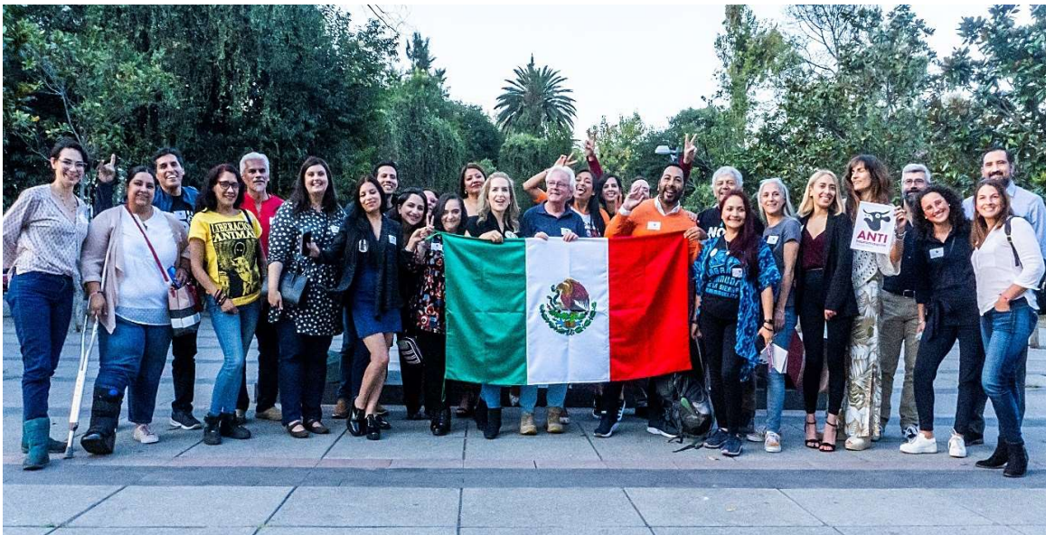
Foto tijdens de summit in Mexico-Stad in november 2022.

In 2007 richtte CAS samen met andere anti-stierenvechtorganisaties het Internationale Netwerk tegen het Stierenvechten op. Toen waren er 22 leden. In 2022 bedroeg dit ledenaantal circa 110. CAS heeft binnen dit Netwerk een leidende positie in een sinds 2015 gevormd Coördinatieteam, op verzoek van CAS, omdat de werkzaamheden door het toegenomen ledental enorm waren toegenomen. De administratie van dit Netwerk wordt door CAS gevoerd. Ook organiseert CAS de jaarlijkse summit van dit netwerk, waarin de organisaties samenkomen. In 2022 organiseerden we voor het eerst na de jaren van de COVID-19-pandemie weer een summit. Deze summit vond plaats op 5 en 6 november in Mexico-Stad. Het was een erg goede en fijne summit. We hebben onder andere een brainstorm gehad over de toekomst van het netwerk. Er is de wens om een gezamenlijk website te hebben voor naar buiten toe, maar ook om onderling makkelijker informatie te delen.