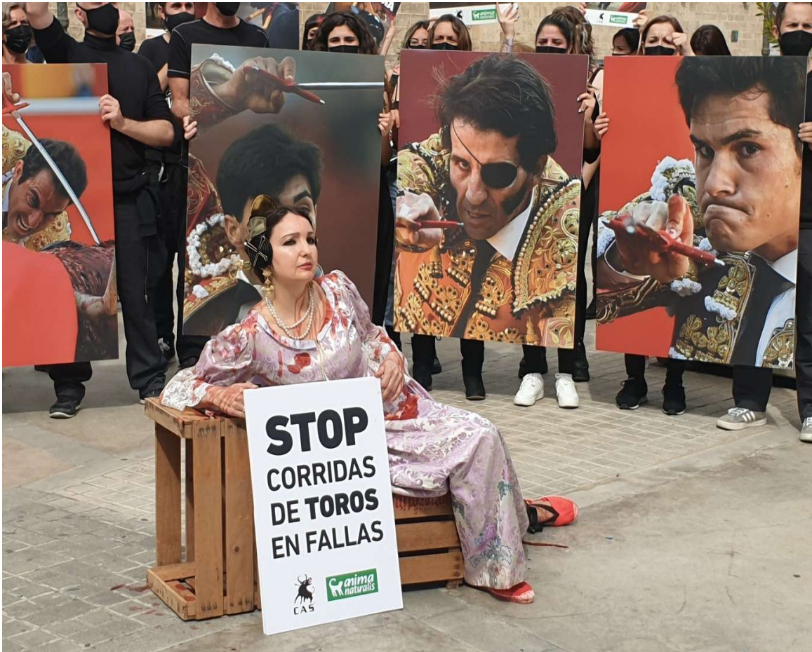
Een protest op 13 maart 2022 tegen stierenvechten tijdens de "Fallas", een traditioneel feest dat jaarlijks in Valencia wordt gehouden.

Het voorstel voor de nieuwe dierenwelzijnswet in Spanje is in 2022 behandeld. Via onze Spaanse zusterorganisatie AnimaNaturalis hebben we meerdere invloedmomenten gehad. Helaas vallen de stieren en jachthonden buiten de wet. Samen met AnimaNaturalis hebben we diverse protesten gehouden tegen stierengevechten in verschillende Spaanse steden, waaronder Sevilla, Madrid en Valencia. Op onze website zijn nieuwsberichten te vinden over deze protesten.