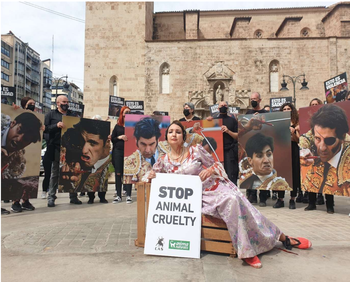
Een protest tegen stierenvechten.

Om de doelstelling te bereiken is in 2008 een meerjarenplan 2009-2023 vastgesteld en zijn projecten verdeeld over drie fases van vijf jaar. Voorts zijn de projecten ondergebracht in vijf zogenaamde strategische routes. De strategische routes omvatten: wetgeving, toeristen-embargo, onvervangbaarheid, sponsors en publieksvoorlichting (incl. fondsenwerving). In de eerste vijf jaar richtten de plannen zich vooral op regionaal niveau, in de tweede vijf jaar op nationaal niveau en in de laatste fase zullen de plannen zich voornamelijk op internationaal niveau richten. In 2022 bevonden we ons in de derde fase.