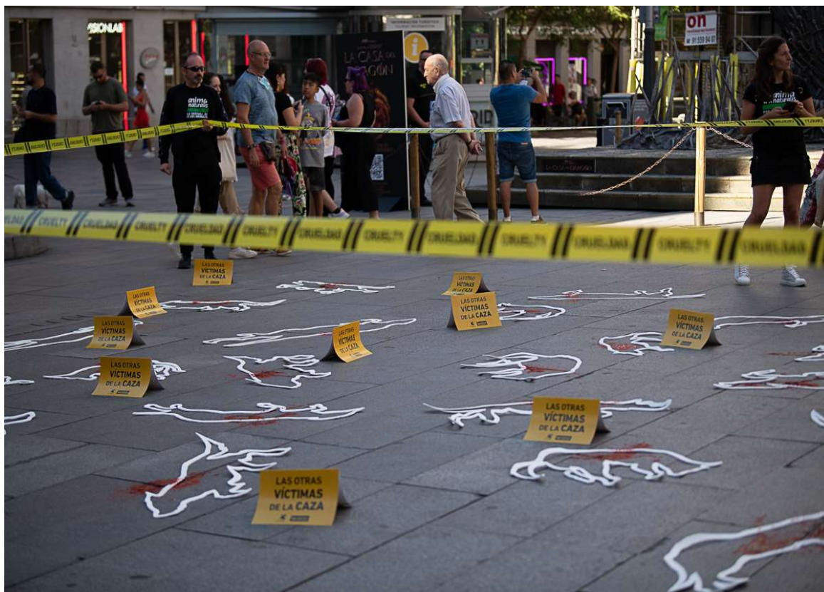
Een protest tegen de jacht met honden in Spanje samen met AnimaNaturalis.